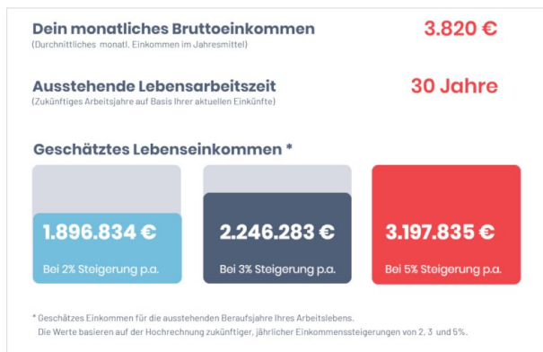
Risikopotential: Hochrechnung der Lebensarbeitsleistung

Gerade Berufstätige in einkommensstarken Karrierejahren, ob Single oder mit Familie, sind durch hohe Verantwortung, Leistungsdruck und lange Arbeitszeiten besonders betroffen.