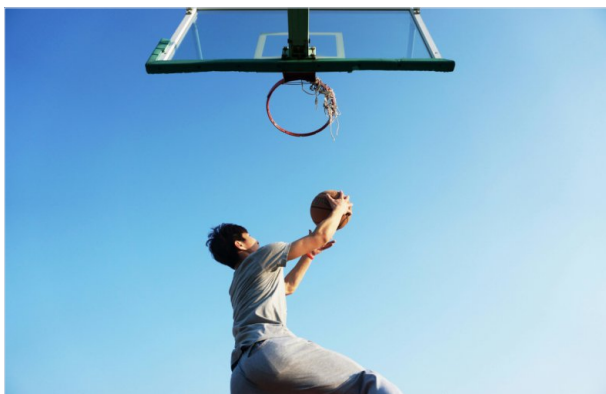
Sicherheit gewinnen – durch professionelle Beratung

Eine Berufsunfähigkeitsversicherung schützt dein wichtigstes Vermögen: Dein Lebens Einkommen. Sie sorgt dafür, dass du finanziell unabhängig bleibst, auch wenn du deinen Beruf vorübergehend oder dauerhaft nicht mehr ausüben kannst. Statt Existenzsorgen gewinnst du Freiheit – die Freiheit, dich auf deine Gesundheit zu konzentrieren, selbstbestimmte Entscheidungen zu treffen und deinen Lebensstandard zu sichern. Savme steht für individuelle Absicherung, klare Beratung und Schutz, der dir langfristige Sicherheit gibt.