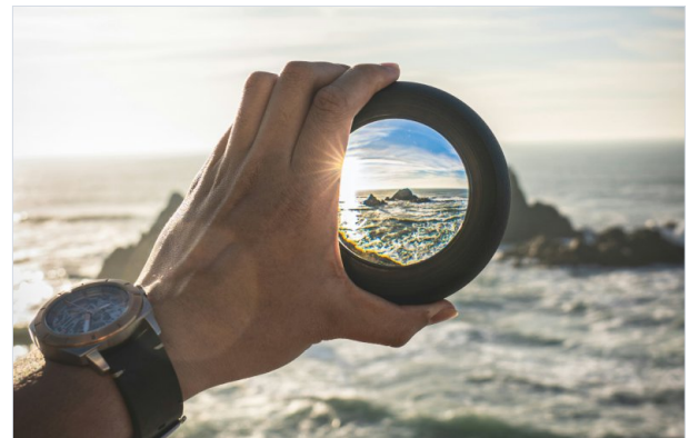
Durch deine Beratung erhältst Du ein klares Bild

Unsere Beratung deckt alles ab, was bei deiner BU-Versicherung entscheidend ist: Wir ermitteln mit Dir deinen Gesundheitsstatus, wir bauen einen Schutz nach Maß und stellen sicher, dass die BU genau so dokumentiert wird, wie Du es wünschst.