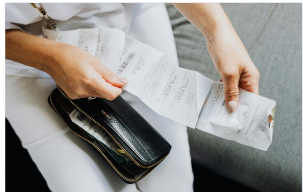
Risiko: Die Kosten laufen weiter und dein Einkommen sinkt

Dieses ist nicht nur der Höhe nach gedeckelt, es wird auch nur so lange gezahlt, wie der/die Betroffene noch arbeitsfähig ist. Mit dem Eintritt einer Berufsunfähigkeit endet das Krankengeld.