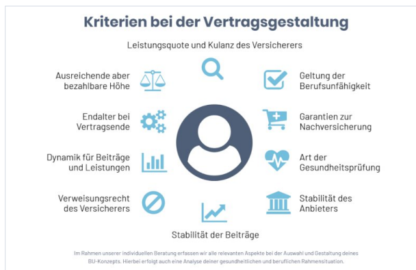
Komplexer Kriterienkatalog bei der Vertragsgestaltung

Speziell beim Abschluss einer Berufsunfähigkeitsversicherung sind vielfältige Kriterien zu beachten, die ohne eine erfahrene Beratungsunterstützung nur schwer zu erkennen sind.